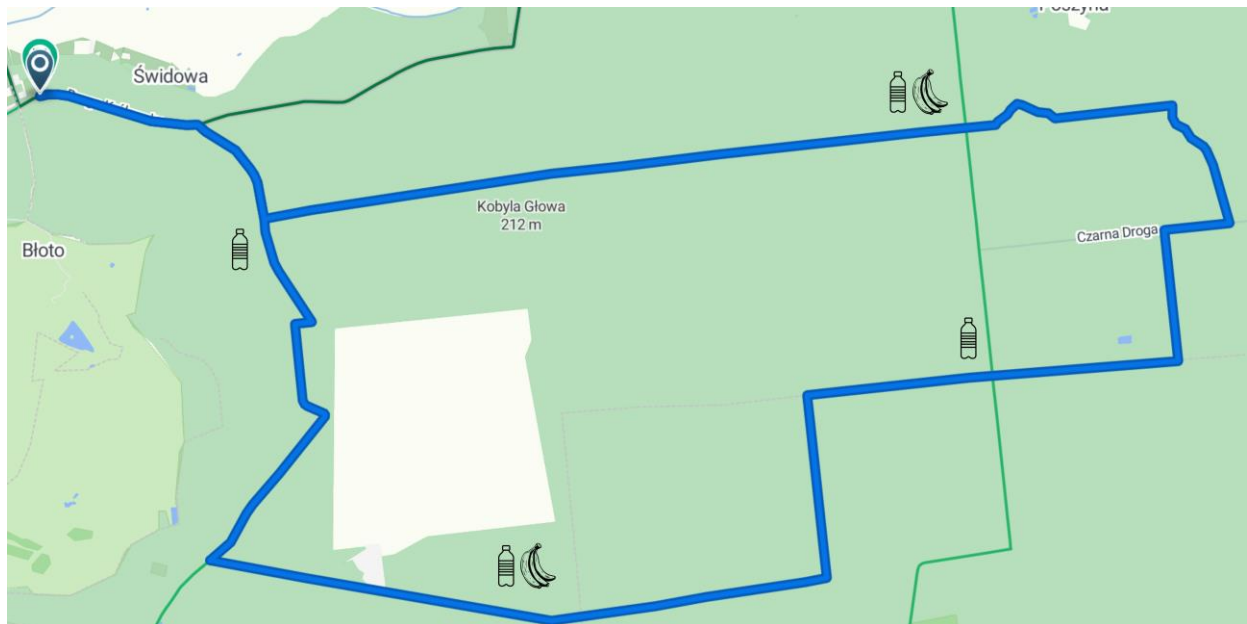
Trasa półmaratonu ( https://web.bikemap.net/r/10491037 )